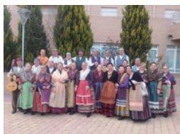
Grupo folclórico "Espigas de la Mancha"